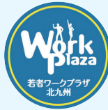
若者ワークプラザ 北九州